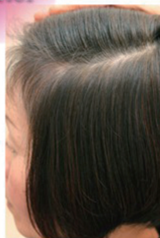
イージーヘナカラーダークブラウンを塗布した後